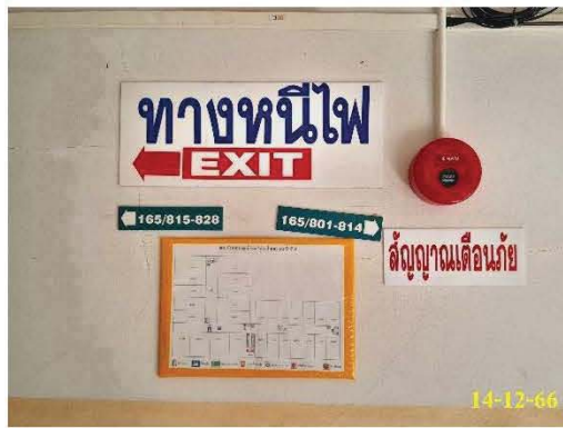
ป้ายบอกทางหนีไฟ