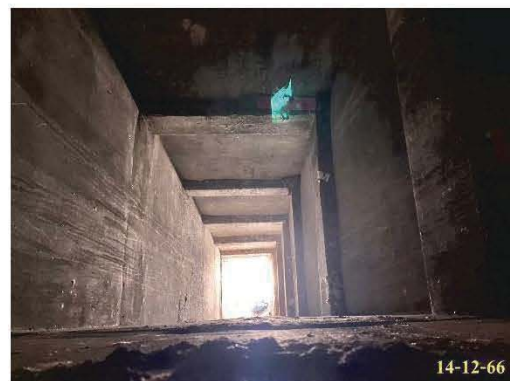
ห้องพักขยะประจำชั้น