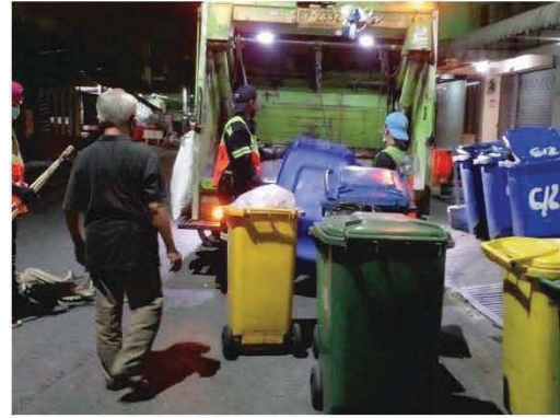
สำนักงานเขตเข้ามาเก็บขนมูลฝอย