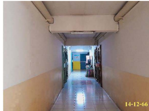
การเดินสายไฟ