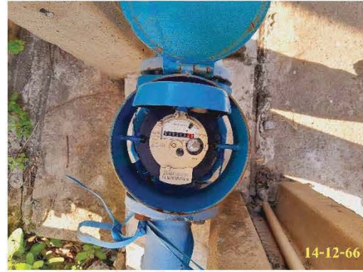
มิเตอร์รับน้ำประปา