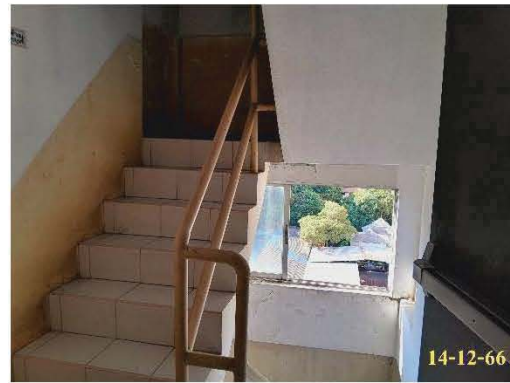
บันไดหนีไฟ ST-2