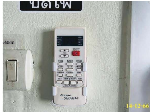
เครื่องปรับอากาศ ปรับอุณหภูมิ 25 องศาเซลเซียส