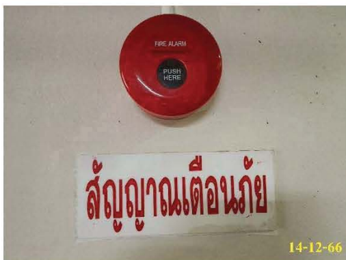
กริ่งสัญญาณเตือนภัย