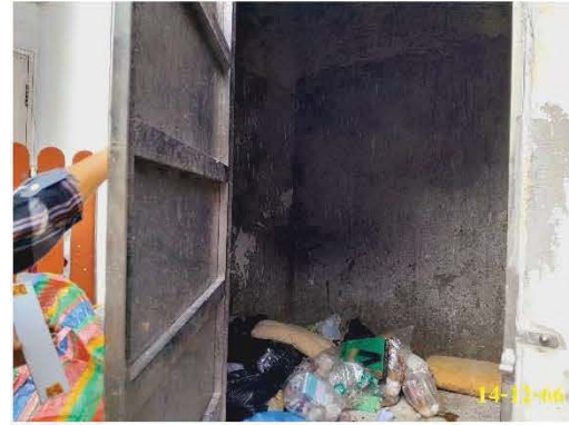
ห้องพักขยะรวม