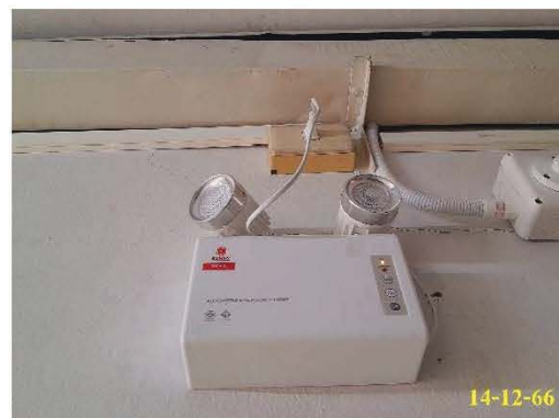
ไฟฉุกเฉิน