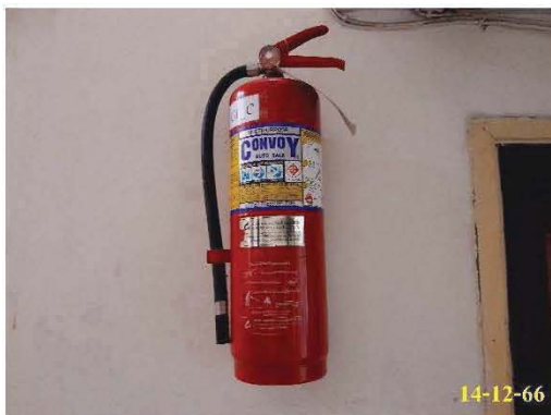
ถังดับเพลิงเคมีชนิด ABC