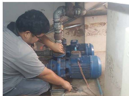
เจ้าหน้าที่บำรุงรักษาระบบเส้นท่อประปา