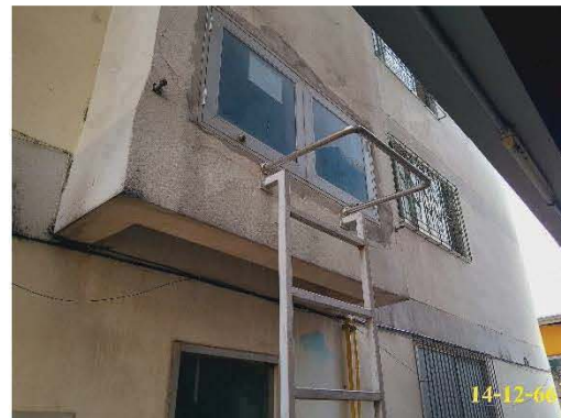
ทางออกบันไดหนีไฟ