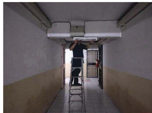
เจ้าหน้าที่ตรวจเช็คอุปกรณ์ไฟฟ้า