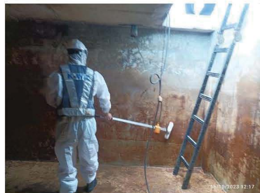
ล้างถังเก็บน้ำใช้