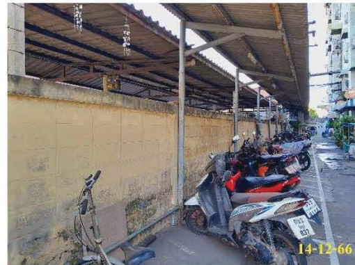
แนวรั้วรอบโครงการ