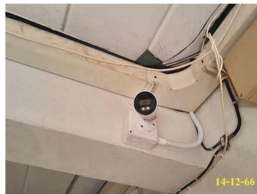
กล้องวงจรปิดภายในอาคาร