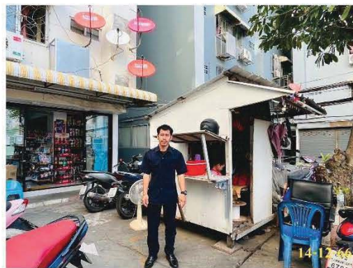
เจ้าหน้าที่รักษาความปลอดภัย