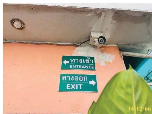
ป้ายจราจร