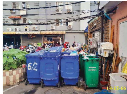
ถังขยะพื้นที่ส่วนกลาง