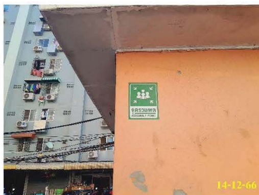
จุดรวมพล