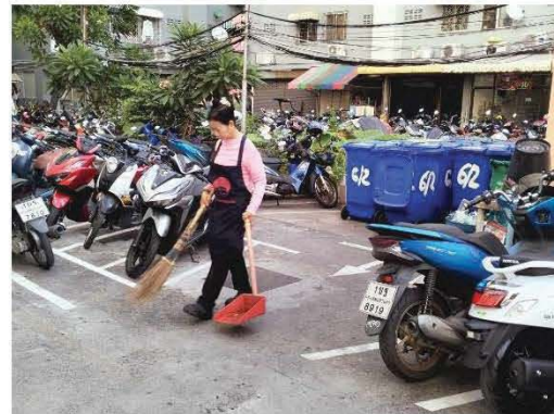
ทำความสะอาดถนนรอบโครงการ