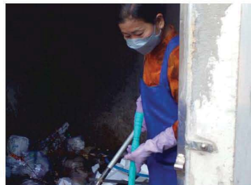
เก็บรวบรวมมูลฝอยภายในห้องทิ้งขยะมูลฝอย