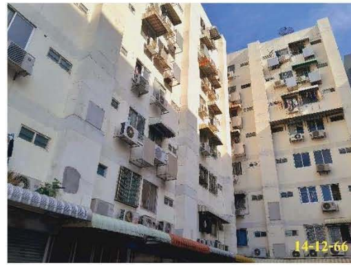
อาคารชุดพักอาศัย