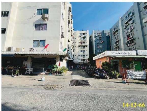
ภาพที่ 2.2-1 รูปแบบโครงการ