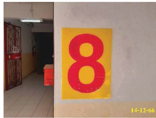
ป้ายบอกชั้น