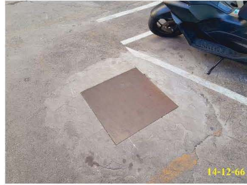
พื้นที่ระบบบำบัดน้ำเสียแบบบ่อเกรอะ-กรองไร้อากาศ