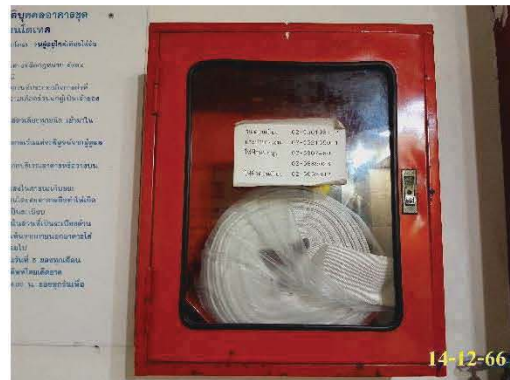
ตู้เก็บสายฉีดน้ำดับเพลิงพร้อมอุปกรณ์