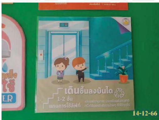
ป้ายรณรงค์การเดินขึ้น-ลงบันได