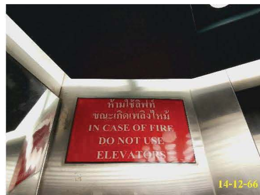
ป้าย "ห้ามใช้ลิฟท์ขณะเกิดเหตุเพลิงไหม้"