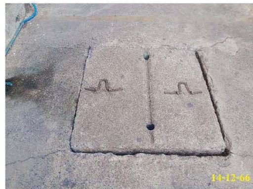
บ่อสุดท้ายก่อนระบายน้ำออก