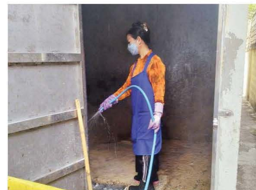
พนักงานทำความสะอาดห้องทิ้งขยะมูลฝอย