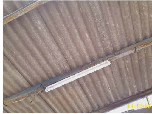
หลอดไฟฟ้าประหยัดพลังงาน