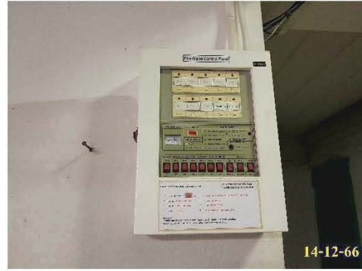
แผงควบคุม