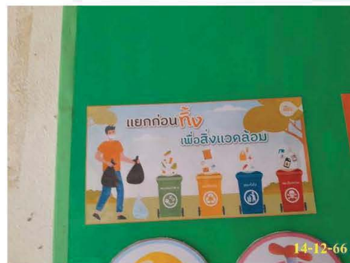
ป้ายรณรงค์การทิ้งขยะ