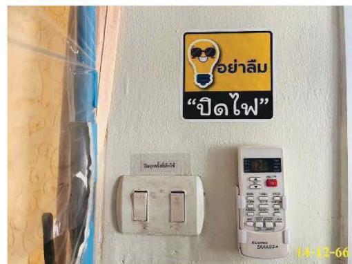
ป้ายรณรงค์ และประชาสัมพันธ์การประหยัดน้ำ และพลังงาน