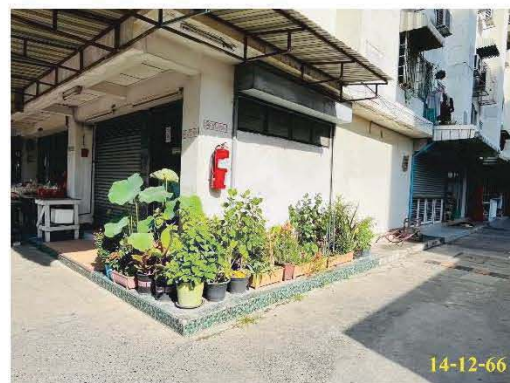
พื้นที่สีเขียว