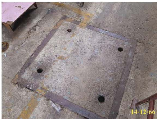
ท่อระบายน้ำรอบโครงการ