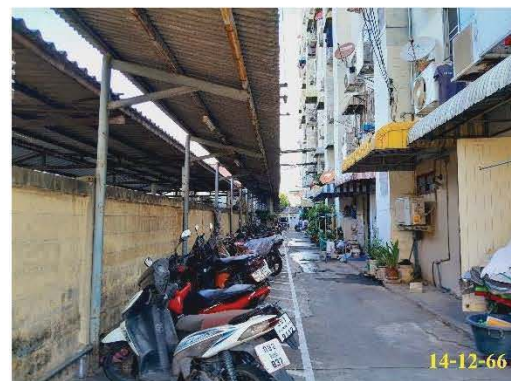
ที่จอดรถ