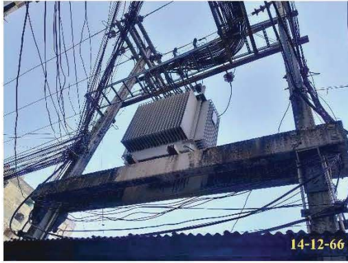
หม้อแปลงไฟฟ้า