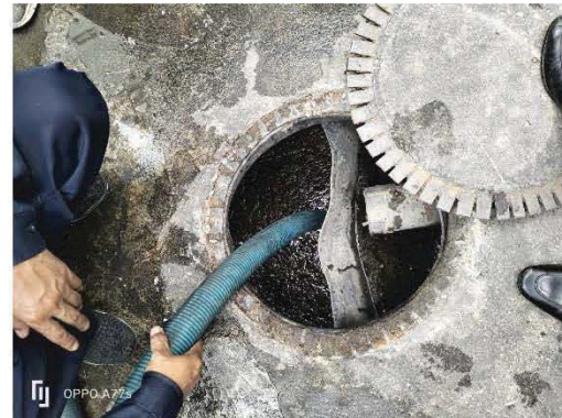
การสูบล้างจากระบบบำบัดน้ำเสีย