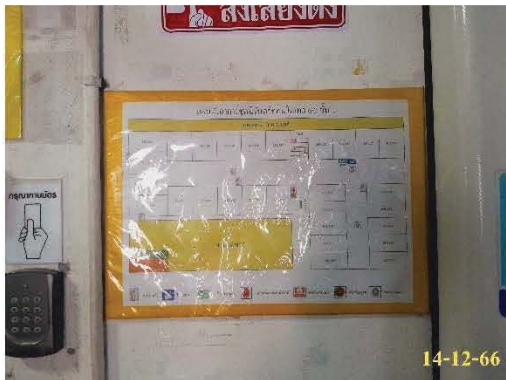
แผนผังเส้นทางหนีไฟ