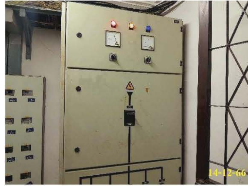
ตู้ควบคุมระบบไฟฟ้าหลัก