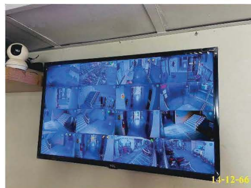
จอมอนิเตอร์ระบบ CCTV