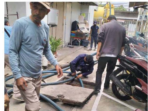
ขุดลอกท่อระบายน้ำ