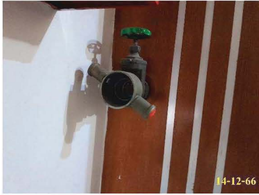
หัวรับน้ำดับเพลิง