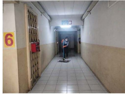
ทำความสะอาดทางเดินภายในอาคารชุดพักอาศัย