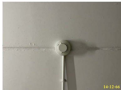
เครื่องตรวจจับควัน